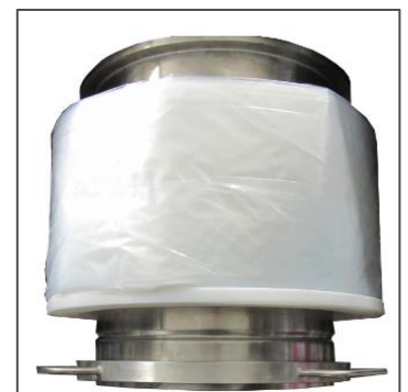
Fotografie der Darstellung