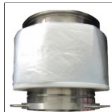
Fotografie der Darstellung